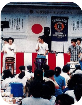
1995年「バーベキューとふれあいの夕べ」

なお、この年より、都筑区福祉農園「障害者とおいも掘大会」に、援助金を拠出している。