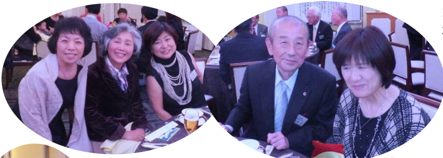
左:三人娘? 右:矢島Lファミリー