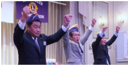
左上:入会式風景 右上:新入会員の誓い 左:ロアー