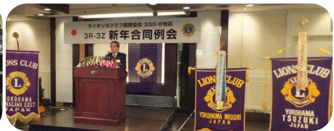
中山会長スピーチ