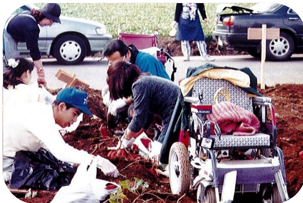
1996年「いも掘り、バーベキュー例会」

畑の中に車椅子を入れ車椅子に乗ったまま芋が掘れるよう考えているメンバー。つき添いの方の真剣な眼差し。ここを掘って芋を取ろうと優しい言葉で車椅子から手を伸ばし土を触ったその時の嬉しそうな「顔」、そばで見ていた私も思わず「ヤッター」と声を出してしまいました。それから芋に手が届くと周りにいた人達が一斉によかったよかったと車椅子に寄り添って私も一緒に喜びあうことが出来ました。